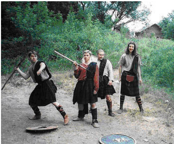
Рисунок 5. Метание тяжести на расстояние.