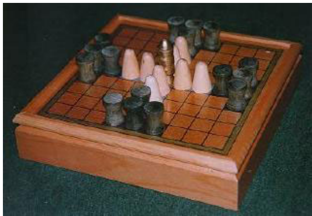
Рисунок 9. Королевский стол.

Лиса и гуси это одна из древнейших европейских игр. Фрагмент игрового поля находили в Дании датированный 400 лет до.н.э. и это являлось первым свидетельством находки игры Tafl или "Королевский стол", как она называлась.